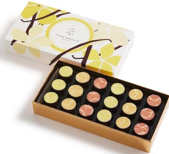
Plumier de 18 unités