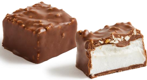
Mendiant Pistache et riz grillé

3 recettes de guimauves à la vanille avec un trio de textures : Une guimauve moelleuse et aérienne, des éclats de fruits secs et une généreuse coque en chocolat craquante.