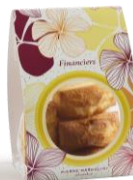
Sachet de 6 unités 13,01 € HTVA