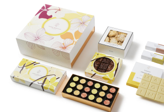
Boîte carrée 71,70 € HTVA