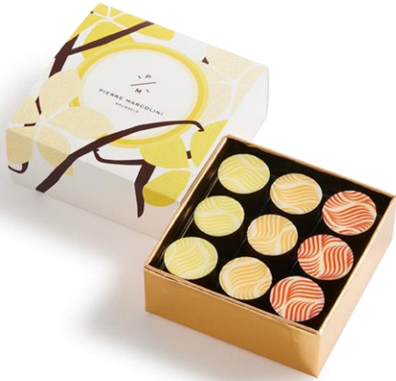
Mini Malline de 9 unités