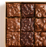
Coffret de 9 guimauves 14,06 € HTVA